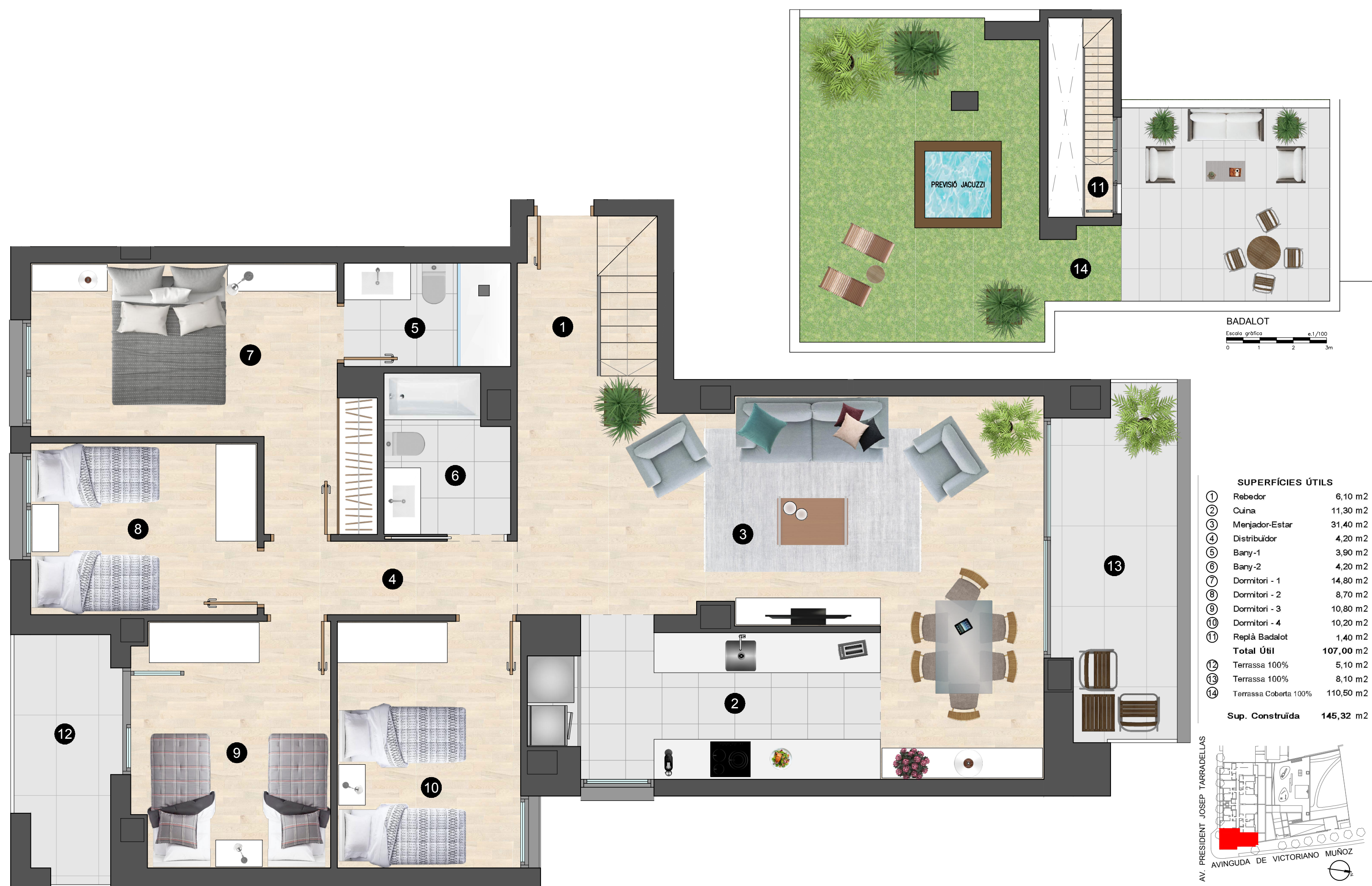
BADALOT Escala gràfica e.1/100 0 1 2 3m